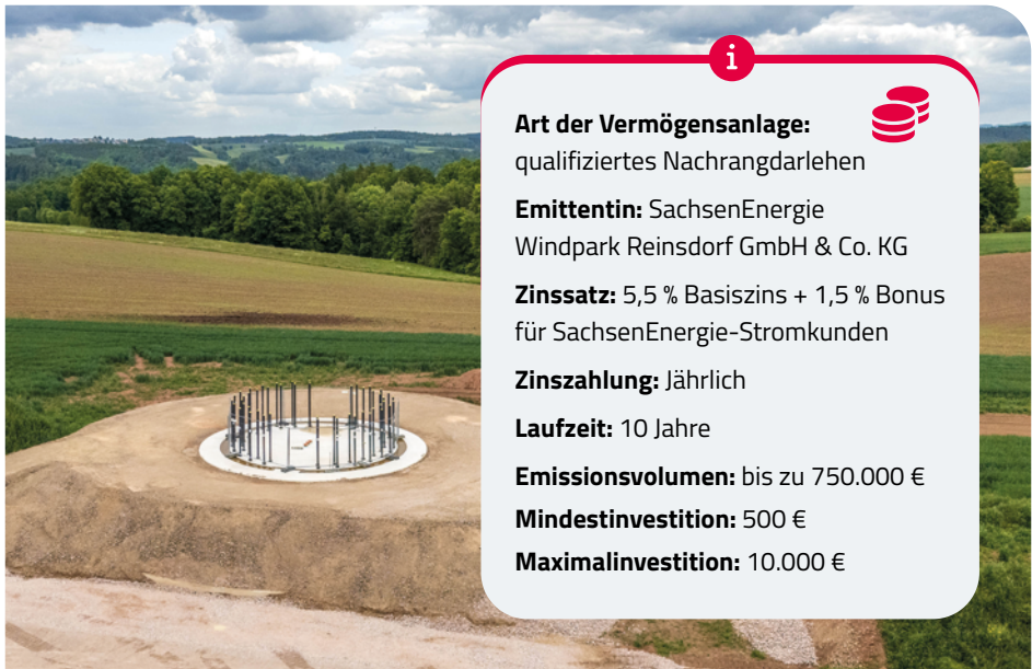
An der Freitagsstraße in Reinsdorf entsteht ein Windpark.